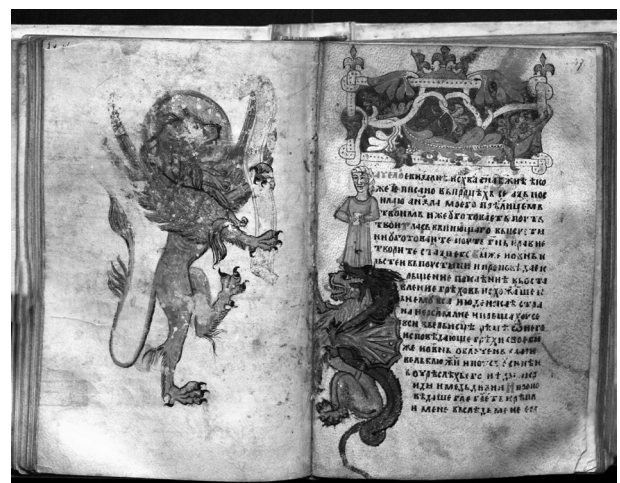
Странице из Никољског јеванђеља