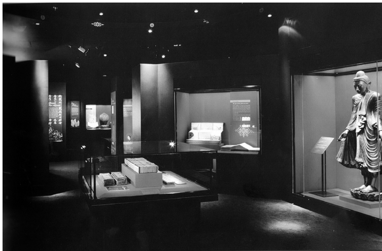
Азијска колекција - галерија на другом спрату Библиотеке

У галерији на другом спрату изложена је поставка под називом „Религиозни обичаји“, која приказује турске и персијске минијатуре, будистичке слике, кинеску свечану одећу са мотивима змаја, али и руске и јерменске иконе из 12. и 13. века. Ова разнолика колекција окупља широк спектар уметничких, сакралних и световних предмета из периода од 2700. године п.н.е. до краја 19. века. И ова поставка подељена је на европски, исламски, и азијски део.