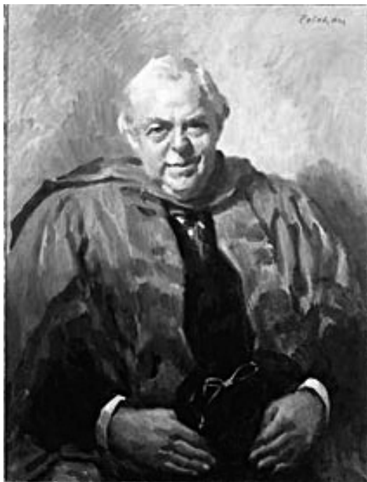
Сер Честер Бити

почео је да прикупља и примерке Курана , тако да данас ова збирка садржи преко 260 одлично очуваних примерака, међу њима и други најстарији примерак Курана на свету. Са путовања по Далеком Истоку, 1917. године, донео је прве примерке јапанских и кинеских цртежа и слика, који су привукли његову пажњу не само богатством илустрација и материјала од којег су израђени, већ и трајном историјском вредношћу текста који се на њима налази.