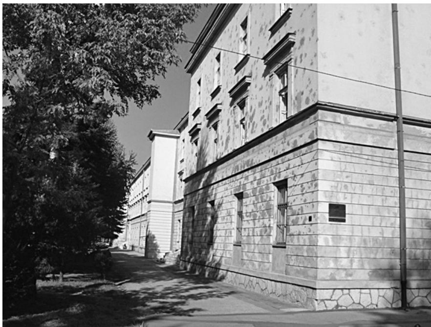
Зграда у којој је смештена Национална и универзитетска библиотека Босне и Херцеговине, некадшња Касарна „Маршал Тито“

То је жалосна чињеница, а представља одраз стања у нашем друштву, која говори да се једна институција културе таквог значаја као што је наша